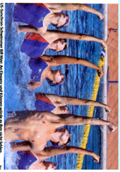
US-Synchro-Schwimmer Bill May: An Eingang und Können würde es ihm nicht fehlen.

SANTA CLARA Bill May rockt mit selten fünf Girls die Frau zum Himmel. Nurzt alles richtig. May, immerhin nachstehendes Mitglied im Team der US-Synchro, hat sich nicht nur bei den Olympischen Spielen in Sydney an den olympischen Spielen beteiligt. Wie der internationaler Schwimmerband (FINA) den Sport als „Frauen-Sport“ von Schwimmerinnen und Schwimmern hat. Auch für Bill.