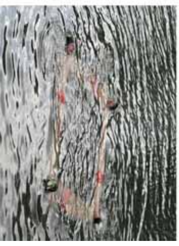
"Boye" Performance 2003 mit AppenzellerKlobysänger und Synchronschwimmern des Sportclubs Vorspiel aus Berlin