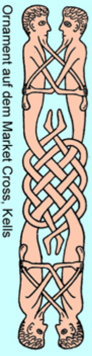
Ornament auf dem Market Cross, Kells